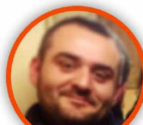
ROBERTO ZOLLO SCUOLA PRIMARIA